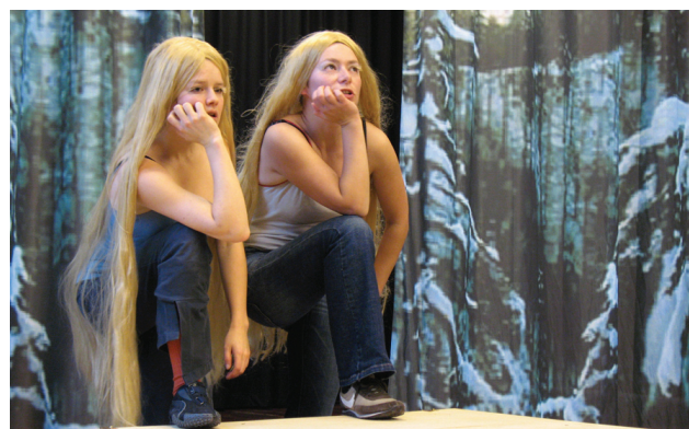
Boolsen en Bärtschiger tijdens een repetitie.

onderzoek naar manieren om de tekst te brengen en te zoeken naar bewegingsmateriaal dat de tekst kan aanvullen.